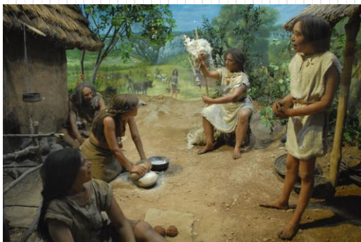
la découverte de l'agriculture