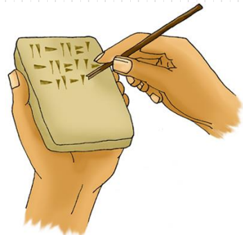
les 1 ères écritures