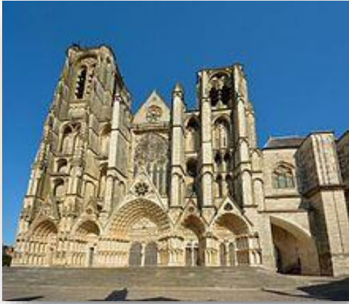
la cathédrale de Bourges

L'Eglise sacre et conseille les rois . L'Eglise est riche : elle possède de vastes domaines et le peuple lui verse un impôt : la dîme . Elle reçoit également les dons des fidèles .