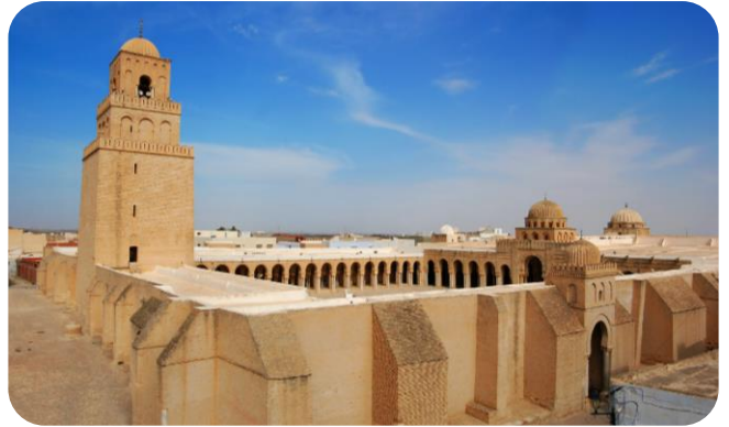
Mosquée de Kairouan (Tunisie)

Sciences, art et commerce rendent célèbres les villes comme Cordoue , Le Caire ou Bagdad .