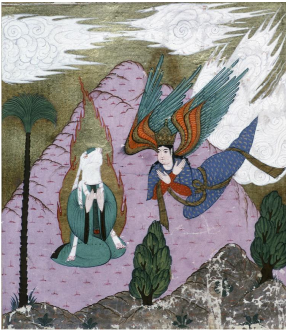
Mahomet et l'ange Gabriel