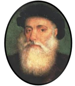
Vasco de Gama