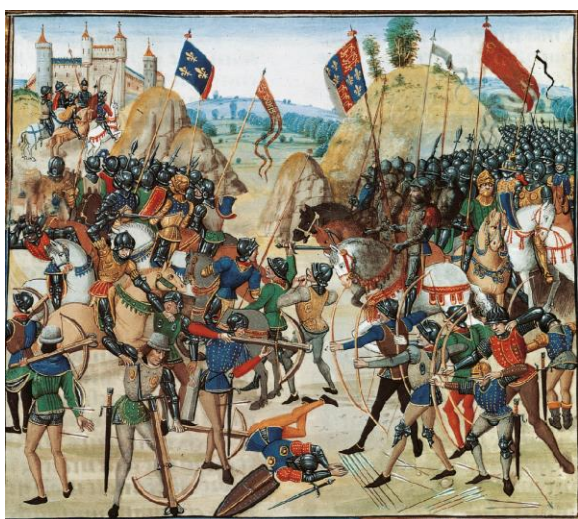
la bataille de Crécy, 1346